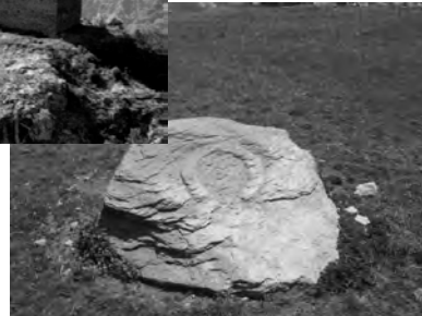
La Jargette en Maurienne