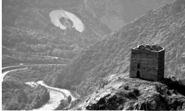
L'AURA en Maurienne