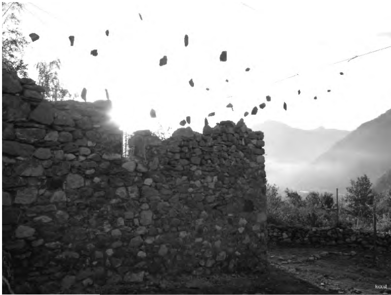
Bibliothèque minérale suspendue Kroust 2014